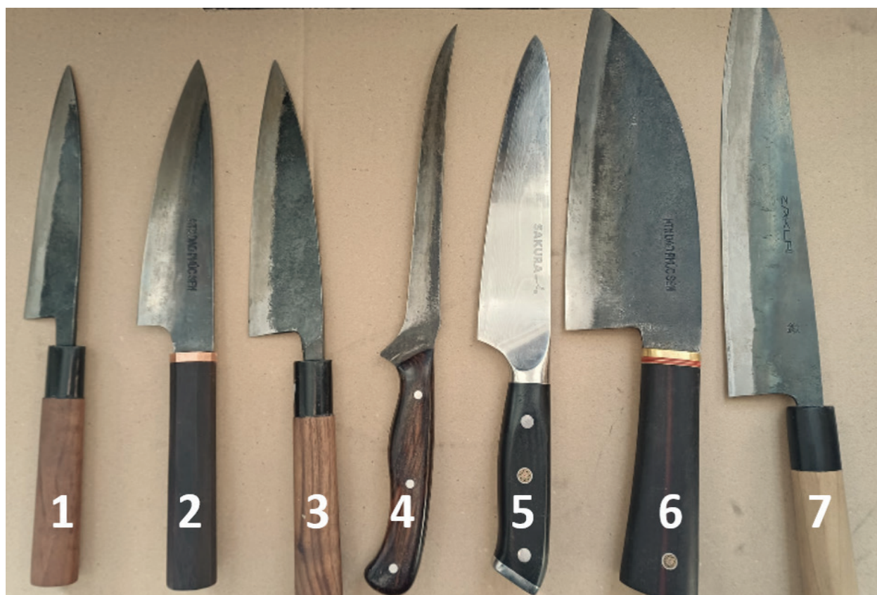
Prikaz dostavljenih noževa